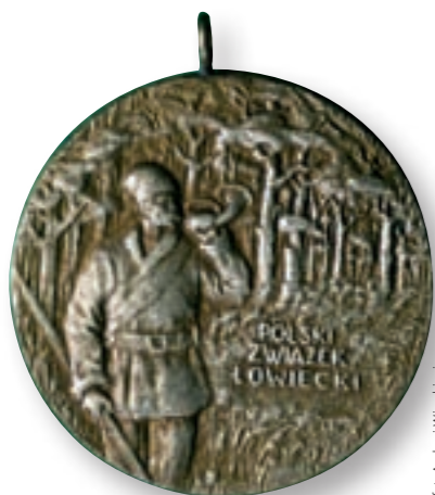
for. Andrzej Wierzbieniec

Przy opracowaniu wniosków należy uwzględnić kilka elementów. Należy przedstawić rys historyczny koła, omawiając okoliczności powstania koła, nazwiska założycieli, skład pierwszego